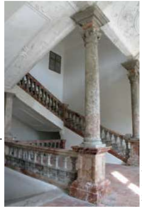
Rekonstruktion der Stiege im Schloss Aurolzmünster in OÖ mit Abdeckungen, Basen und Postamenten aus Schwarzenseer Marmor.

Die Einsatzmöglichkeiten für Schwarzenseer Marmor werden, bedingt durch die sorgfältige Materialwahl im Steinbruch und die Arbeitsvorbereitung mit CAD, immer vielfältiger. Neben der Verwendung in der Restaurierung begeistert er bei der Außenraumgestaltung und im gehobenen Innenausbau. Typische Anwendungen sind Bodenbeläge, Wand- oder Pfeilerbekleidungen und Küchenarbeitsplatten. Badgestaltungen und Wellnessbereiche sind weitere beliebte Einsatzbereiche. Dank der Verarbeitung ab dem Rohblock wird Schwarzenseer Marmor bei Kienesberger auch zu aufwändigen Massivarbeiten geformt: Säulen, Balustraden, Altäre, Skulpturen oder Brunnen, aber auch Waschbecken oder Duschtassen werden auf modernsten CNC-Maschinen passgenau gefräst und von umfassend ausgebildeten Handwerkern veredelt. •